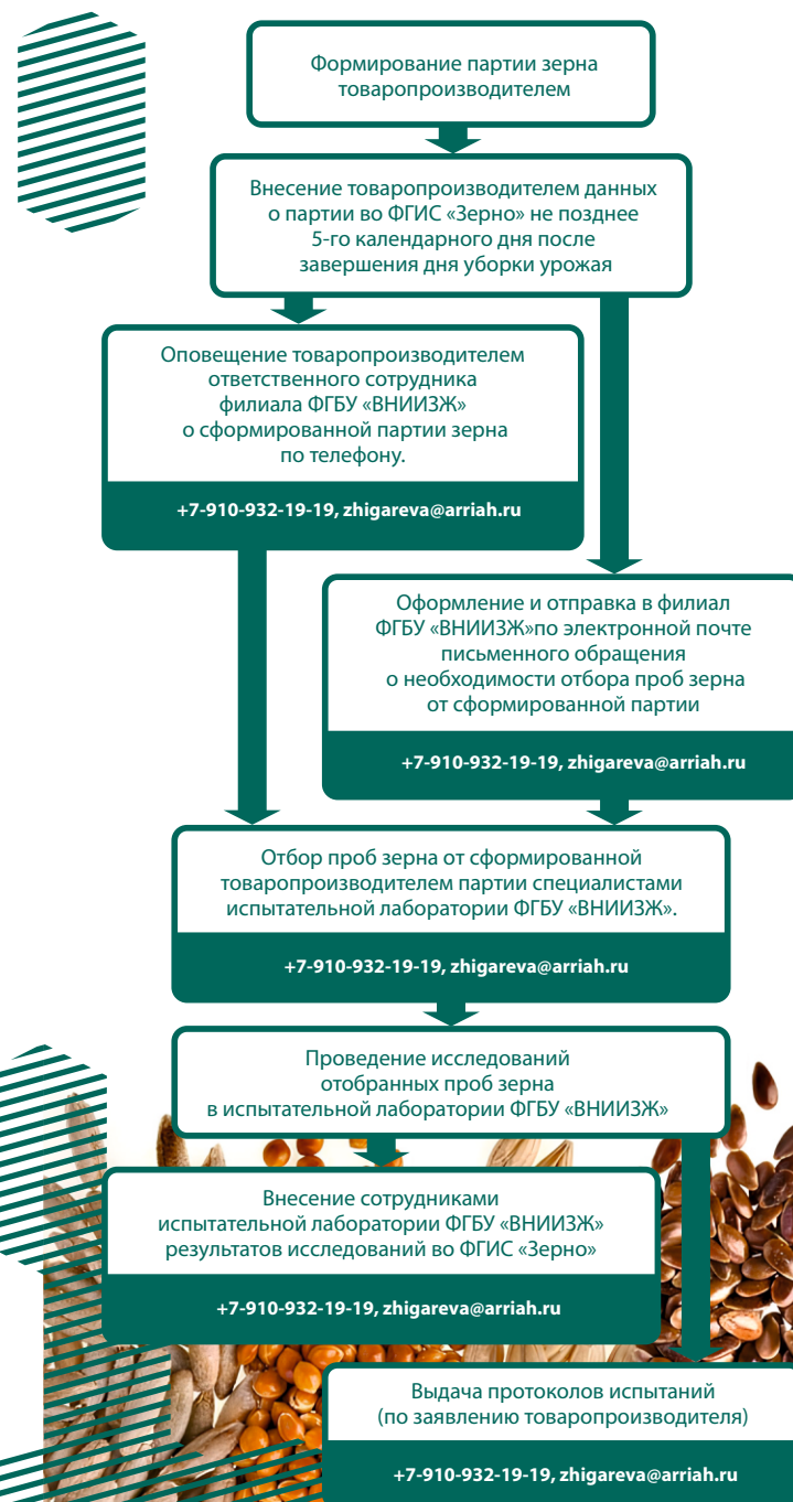
Схема осуществления мониторинга зерна урожая 2024 года